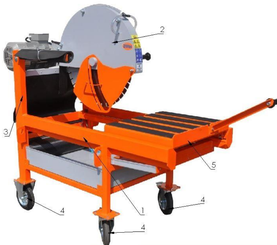
Figura 1. - ZIV KTV 650 E vedere axonometrică din față