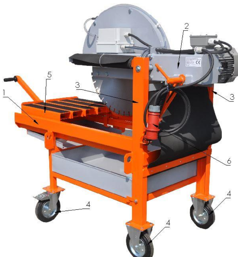
Figura 2. - ZIV KTV 650 E vedere axonometrică din spate